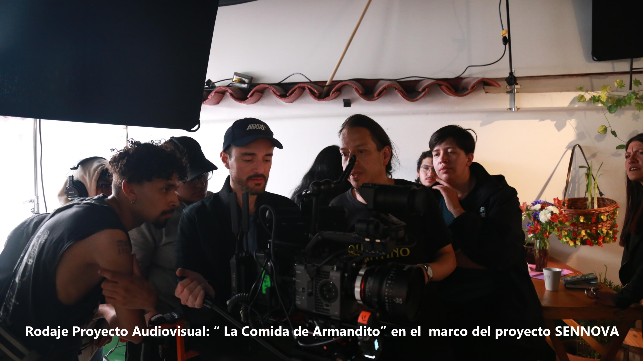
Rodaje Proyecto Audiovisual: " La Comida de Armandito" en el marco del proyecto SENNOVA